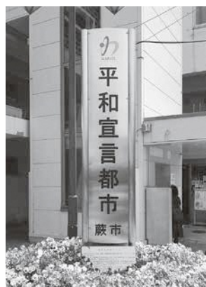
駅前広場にある 平和都市宣言塔