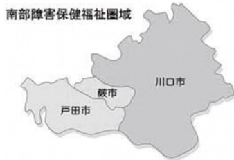
障害者入所施設の整備に向けて最大限の努力を