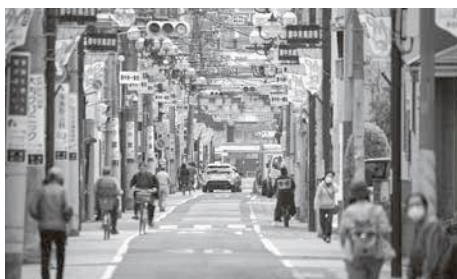
本気の活性化策が必要です