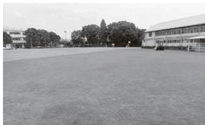
東小学校の一部芝生化されたグラウンド 他校も導入推進を