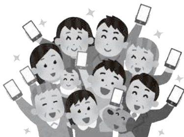
デジタルサービスの活用で住みよいまちに！

の申し込みは、申込書の提出や電話だけでなく、電子メールでの受付も行っている。LINEの利用については、受付方法が複数になり、アカウ