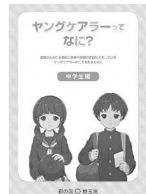
ヤングケアラー啓発のため 配付されているハンドブック