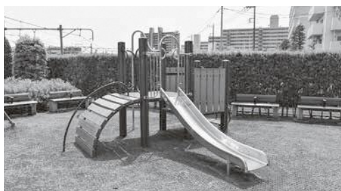
わらび公園に小型の複合遊具の設置を

都市整備部長 川口市の条例は、分譲マンションに対する定期報告制度などを規定した先進的な条例と認識しているが、本市においては、マンション管理の適正化の推進に向けて、まずは計画の策定と管理計画認定制度への対応が重要と考えているので、条例の制定については近隣市の動向にも注視しながら、必要に応じて調査・研究していきたい。