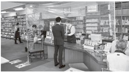
新型コロナウイルス感染防止対策を行いながら開館している蕨市立図書館