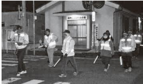
蕨の魅力をつくる地域活動（年末夜警の様子）

議員 入所しても待機者数が変わらないのは待機者以外にも入所を必要とする人がいるということ。必要性は高い。ところで、慣れない施設入所への不安から体調を崩し断念した方がいる。市内等近隣に施設があり、ショートステイや相談等で利用経験があれば入所の可能性も広がる。近隣市、特に戸田市との協議を具体的に進める考えは。