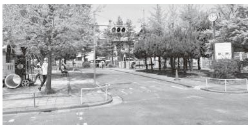
今年度設計を行い来年度工事が予定される大荒田交通公園

都市整備部長 土地区画整理事業区域に今後計画する5つの街区公園と富士見公園について、市民参加のワークショップを開催し、基本構想を策