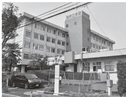
市民の命や健康を守り 地域医療の拠点である市立病院

総務部長 総合的に検討したい。ユニバーサルデザインフォントについては、4月の広報紙のお知らせ版から導入していく。